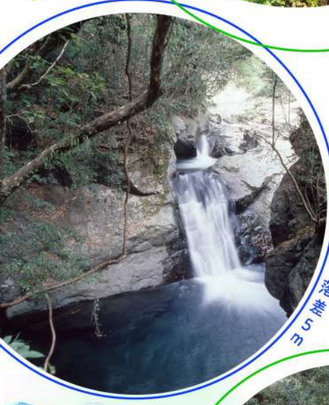
no.2 H川滝 落差 15 m