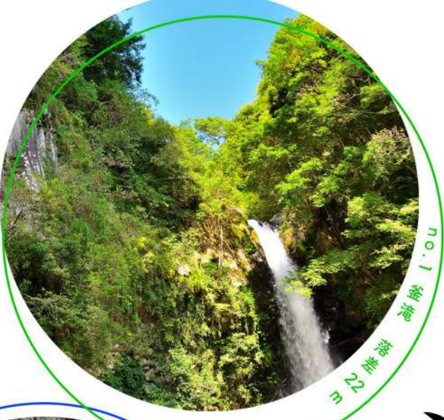
no.1 龍滝 落差 27 m