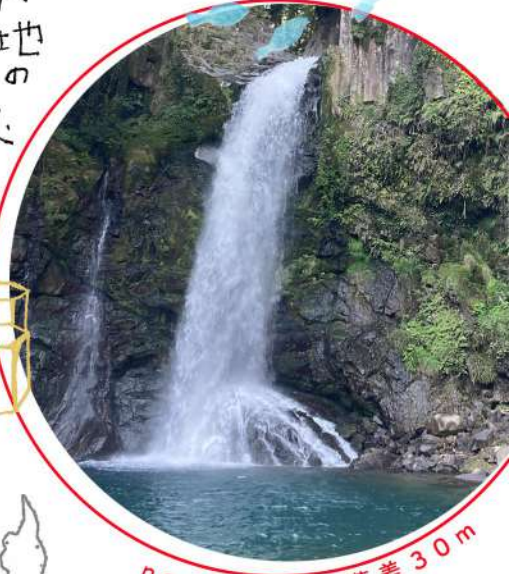
no.7 大滝 落差 30 m