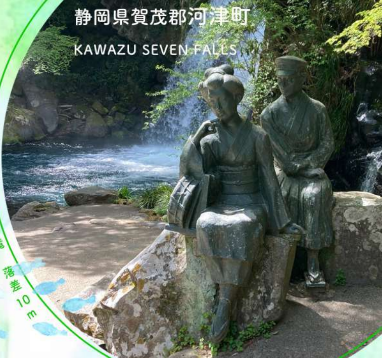
no.4 初景滝 落差 10 m