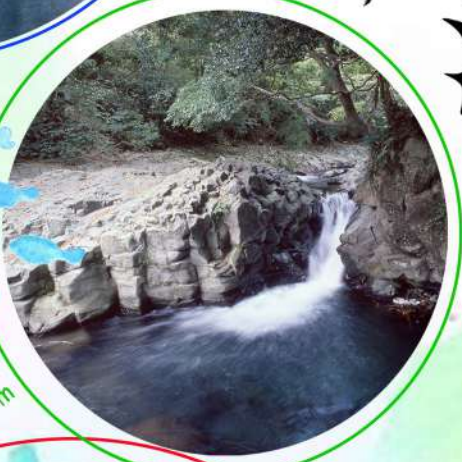
no.5 カニ滝 落差 2 m