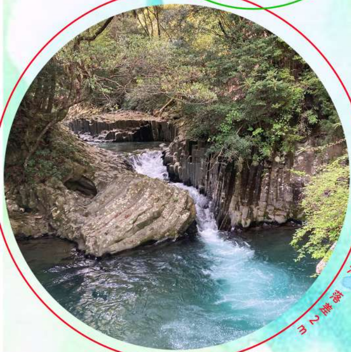
no.6 田代滝 落差 27 m