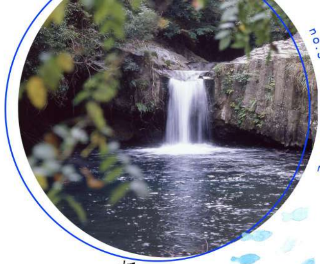
no.3 蛇滝 落差 3 m