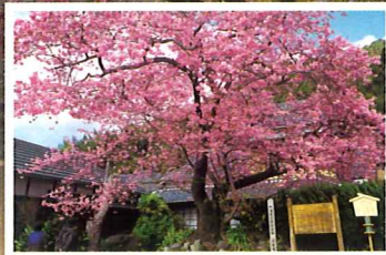
飯田家の河津桜原木