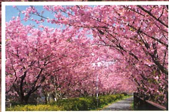
河津川沿いの河津桜トンネル