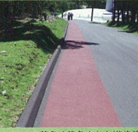
茶色く着色された遊歩道

赤い点線部分(管理用道路)を通行する際は、下の写真の茶色く着色された遊歩道を歩いてください。