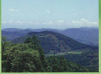
展望所から望む鉢の山