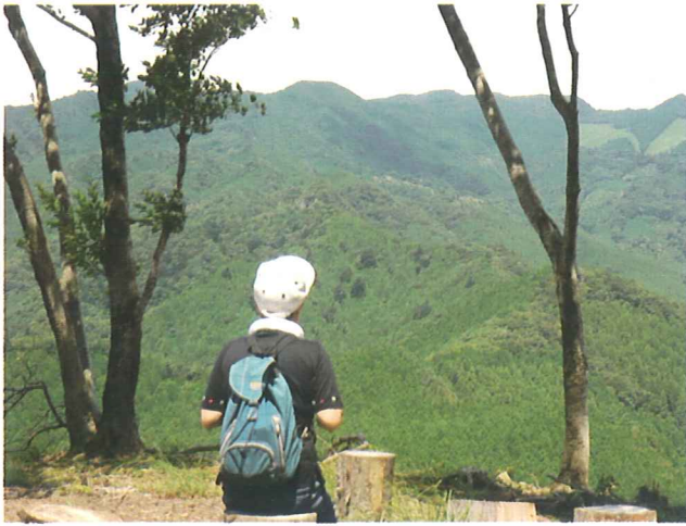
▲山頂広場から天城連山を…

バス停からおおよそ4km、1時間20分ほどで第一駐車場に着く。ここから山頂まで標高差約260mある。目の前に広がる桜の丘の斜面をジグザグと上る。次第に周りの景色が広がり展望がよくなる。