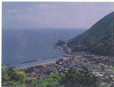
城山下の休憩舎より河津方面を望む