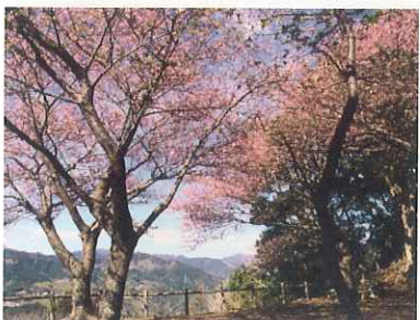
城山山頂の河津桜