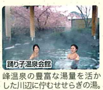
踊り子温泉会館 峰温泉の豊富な湯量を活かした川辺に佇むせせらぎの湯。

川端康成の『伊豆の踊り子』の舞台にもなった河津は、当時の光景をイメージしてくれる自然や見どころが数多く残されています。自然や、情緒溢れるハイキングコース。そして歩き疲れた体は、たっぷりの湯で癒してくれます。少し足を延ばせば、見所・湯所・花所にあふれる河津温泉郷をゆったりの人びりお楽しみ下さい。